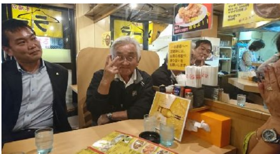
自由行動の後はすすきのラーメン横丁♪