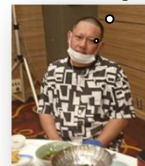
乗り物酔いで食べられません・・・