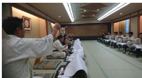
一日目終了お疲れ様でした♪