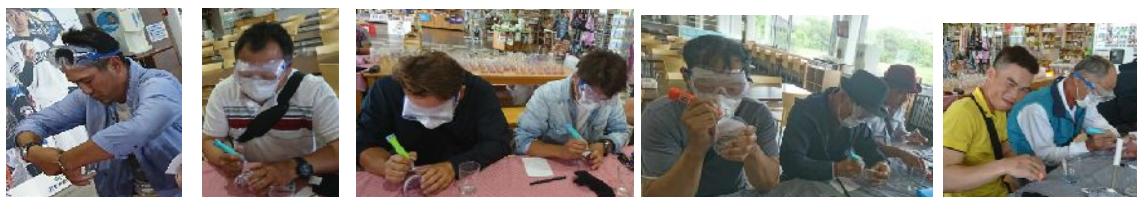
最初は面倒くさがっていたのに、時間がたつにつれ真剣な表情に！！