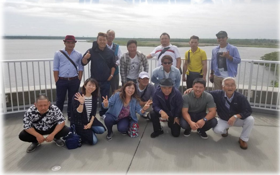
** ウトナイ湖 **