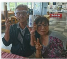
社長と専務 ノリノリです♪