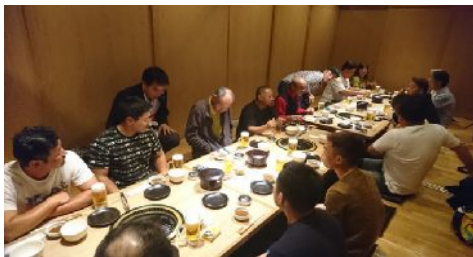
ゴルフ組と合流後 ジンギスカン♪