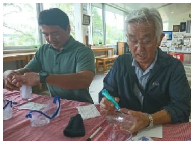
なんと専務！ 自前の器具を持ってるそうです♪ ～～～上手いはずだ(笑)・・・～～